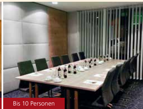
Bis 10 Personen

Bilder zeigen die bereits bestehenden Tagungsräume.